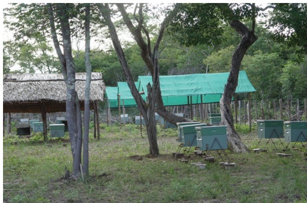
Figura 1. Colmeias instaladas sob coberturas artificiais de palha e tela e sob a copa de árvores (Castelo do Piauí, PI, 2004).