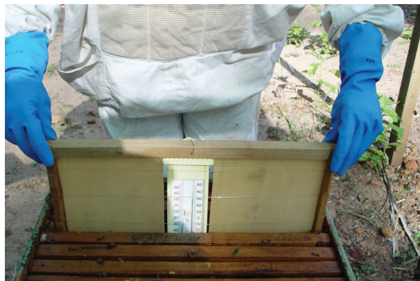
Figura 2. Termômetro de máxima e mínima inserido em posição central da colmeia (Castelo do Piauí, PI, 2004).

O desenvolvimento das colônias foi acompanhado por meio de mapeamentos e pesagens. Para a pesagem, utilizou-se uma balança mecânica de plataforma, com carga máxima de 150 kg, instalada na área do apiário. O procedimento foi efetuado no final de cada dia experimental, quando a maioria das abelhas já se encontrava na colmeia. O alvado da colmeia foi fechado com o auxílio de um pedaço de espuma sintética, para evitar a saída das abelhas durante a pesagem.