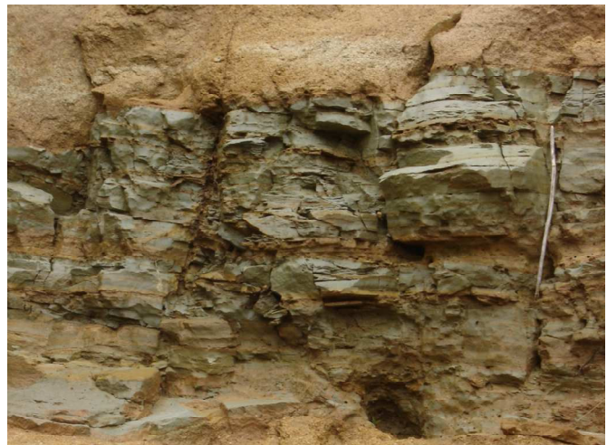
Figura 2: Conglomerados com Folhelho, material de origem do Argissolo Vermelho-Amarelo alítico plúntico.