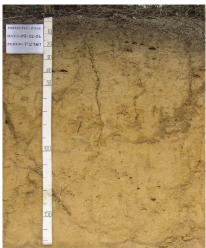
Figura 5: Latossolo Amarelo distrocoeso típico.