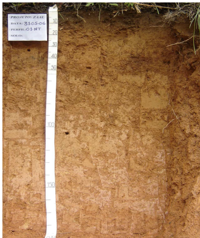
Figura 3: Latossolo Vermelho-Amarelo eutrófico típico.