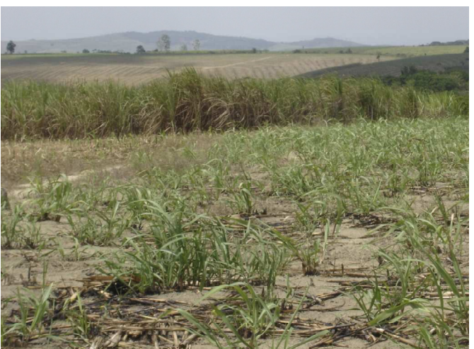
Figura 6: Sedimentos do Grupo Barreiras em ambiente de tabuleiro, material de origem do Latossolo Amarelo distrocoeso típico.