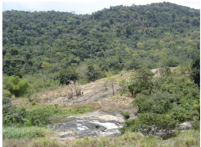
Figura 4: Rochas Cristalinas, material de origem do Latossolo Vermelho-Amarelo eutrófico típico.