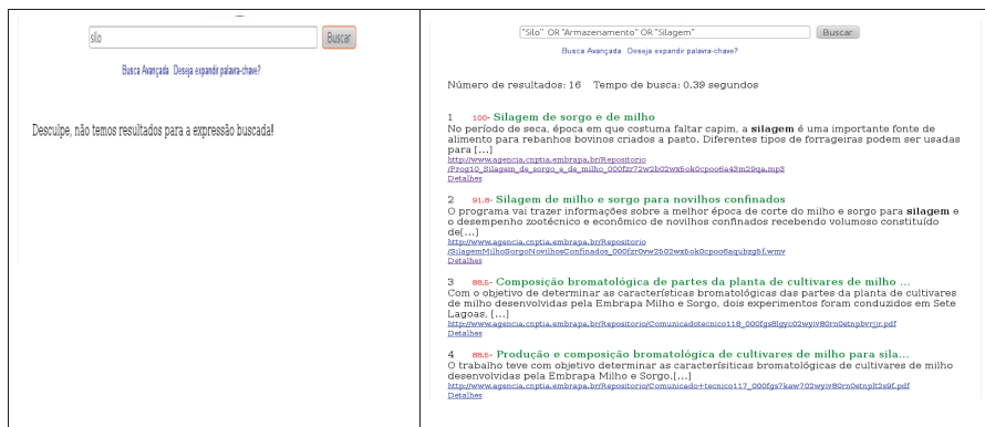
Figura 2. Comparativo dos resultados das buscas.

A evolução da ferramenta de busca, para incorporar a expansão, foi possibilitada pelo reuso da implementação de um Web Service, que permite acessar o banco de vocabulário controlado da Agência (SOUZA et al., 2010).