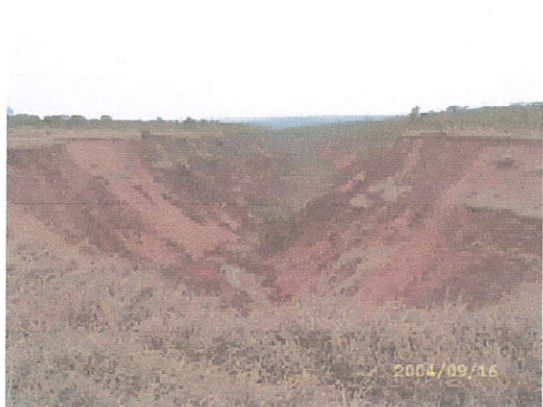
Figura 13. Erosão por voçoroca

A presença de corpos d'água na área de estudo se restringem ao leito do rio Araguaia e Araguaianha, córregos e alguns açudes utilizados para dessedentação do rebanho bovino. Na Figura 14 verifica-se um trecho do rio Araguaia, no período de seca.