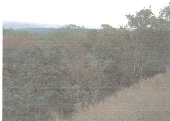
Figura 3. Fitofisionomia Cerradão.

A Savana Arborizada (Cerrado) caracteriza-se por ser uma formação com fisionomia arbórea distribuída esparsamente sobre um substrato composto de gramíneas, podendo ser natural ou antropizada. As árvores são finas e tortuosas, sujeitas ao manejo de fogo anualmente. Na área de estudo foi individualizado o Cerrado fechado e o Cerrado aberto que seria o Cerrado senso restrito, porém apresentando coberturas arbóreas diferentes observadas em campo e nos padrões da imagem de satélite. Nas Figuras 4 e 5 podem ser verificadas a fitofisionomias destas classes de mapeamento.