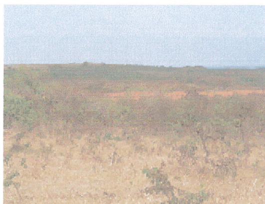
Figura 5. Fitofisionomia Cerrado aberto.

A Savana gramíneo-lenhosa (campo) caracteriza-se por ser uma formação com fisionomia graminosa, dominada geralmente por plantas graminóides e herbáceas. Na área de estudo ocorrem quatro diferentes fisionomias (subformações) que foram mapeadas e associadas a esta formação. O campo de bambu (Figura 6) nos topos e encostas dos morros é formado quase sempre pela grama taquari.