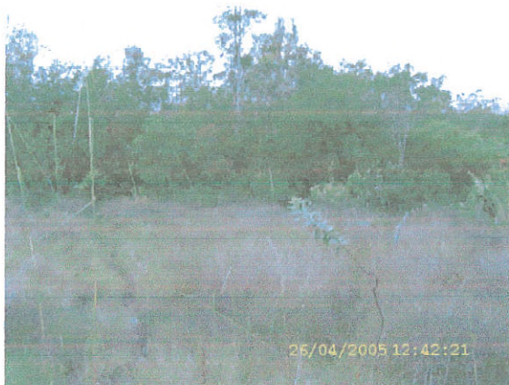
Figura 2. Fitofisionomia Floresta-de-Galeria.