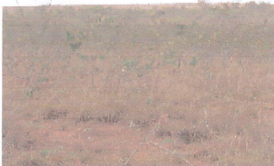
Figura 8: Fitofisionomia Campo arbustivo.

Quanto ao sistema produtivo da região, responsável pelo antropismo da área, este é pautada na agricultura de grãos de soja e milho e, em menor escala, na pecuária de corte, sobre pastagem cultivada, principalmente do gênero Brachiaria . Com relação as pastagens cultivadas foram identificadas a classe de pastagem cultivada limpa (Figura 9) e pastagem cultivada suja (Figura 10), sendo esta última referente as pastagens em formação, com leiras ou com a presença de arbustos.