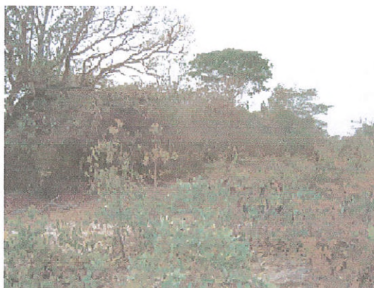
Figura 10. Pastagem cultivada suja.

As áreas agrícolas foram mapeadas em uma única classe, sem individualizar tipos de cultura e tampouco solo descoberto em preparo para plantio ou pós-colheita. De maneira geral o calendário de plantio segue as estações anuais Verão (safra) e Inverno (safrinha).