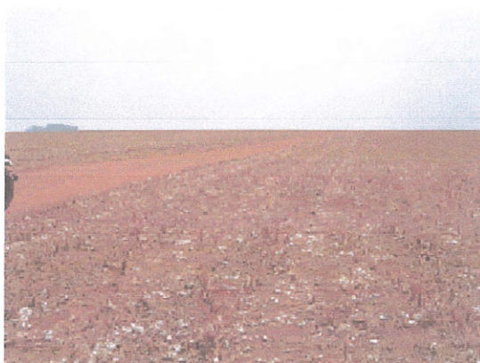
Figura 11. Área pós-colheita de algodão.

O plantio da safrinha geralmente ocorre entre março e abril, com a colheita entre julho e agosto. Na parte referente a Goiás, as principais culturas são, em ordem decrescente, o milho safrinha, o sorgo, o trigo, a aveia e o girassol. Às vezes é plantado milheto, para servir de palha de cobertura para plantio direto. Pode vir depois da safrinha ou mesmo concomitante a ela, integrada com o gado. Já na parte referente a Mato Grosso as principais culturas são, em ordem decrescente, o milho safrinha, o trigo safrinha, o sorgo e o milheto, para servir de palha. As Figuras 11 e 12 mostram fisionomias das áreas agrícolas.