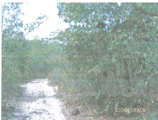
Figura 4. Fitofisionomia Cerrado fechado.

A Savana Arborizada (Cerrado) caracteriza-se por ser uma formação com fisionomia arbórea distribuída esparsamente sobre um substrato composto de gramíneas, podendo ser natural ou antropizada. As árvores são finas e tortuosas, sujeitas ao manejo de fogo anualmente. Na área de estudo foi individualizado o Cerrado fechado e o Cerrado aberto que seria o Cerrado senso restrito, porém apresentando coberturas arbóreas diferentes observadas em campo e nos padrões da imagem de satélite. Nas Figuras 4 e 5 podem ser verificadas a fitofisionomias destas classes de mapeamento.