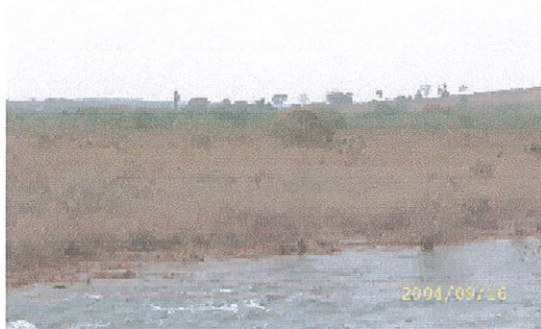
Figura 7. Fitofisionomia Campo de várzea.