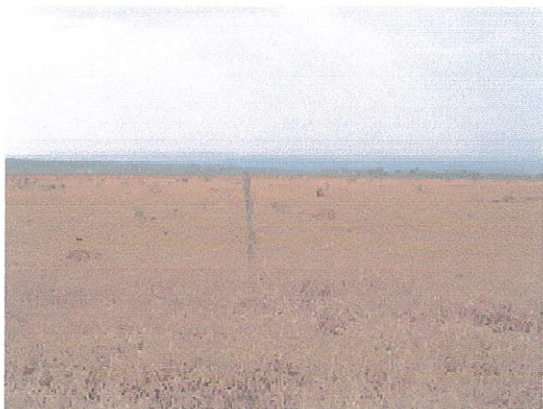
Figura 9. Pastagem cultivada limpa.

Quanto ao sistema produtivo da região, responsável pelo antropismo da área, este é pautada na agricultura de grãos de soja e milho e, em menor escala, na pecuária de corte, sobre pastagem cultivada, principalmente do gênero Brachiaria . Com relação as pastagens cultivadas foram identificadas a classe de pastagem cultivada limpa (Figura 9) e pastagem cultivada suja (Figura 10), sendo esta última referente as pastagens em formação, com leiras ou com a presença de arbustos.