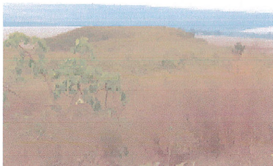
Figura 6. Fitofisionomia Campo de bambu.