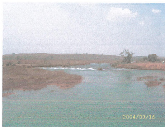
Figura 14. Trecho do rio Araguaia