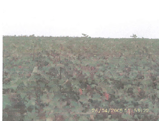
Figura 12. Área com cultivo de algodão.

A fragilidade natural do terreno associado ao sistema produtivo instalado na região favoreceu o aparecimento de extensas e profundas voçorocas , que puderam ser vistas nas imagens de satélite e mapeadas. A voçoroca Chitolina, na fazenda homônima, em Mineiros –GO e as voçorocas Olhos d'água (Figura 13), na fazenda Santo Antônio e Treze Pontas, na fazenda homônima, ambas em Alto Taquari –MT se destacam pelo seu tamanho e impactos ambientais e econômicos causados à região. As áreas mapeadas como sede se referem as fazendas de gado e de produção agrícola, além dos silos para armazenamento. Geralmente essas propriedades são contornadas por fileiras ou cerca de eucaliptos. Uma grande mancha na parte sudoeste da região refere-se as instalações da estrada de ferro FerroNorte.