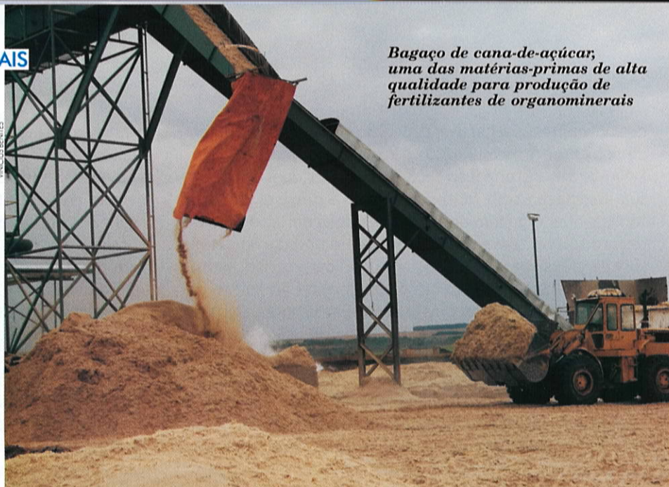
Bagagaço de cana-de-açúcar, uma das matérias-primas de alta qualidade para produção de fertilizantes de organominerais

De todo o volume de fertilizante de base orgânica (orgânico e organomineral) produzido no país, apenas uma pequena parte é destinada a grãos e fibras. A pouca utilização por esse segmento pode ser atribuída à baixa concentração de nutrientes e às características físicas do produto, uma vez que a maior parte de fertilizantes organominerais é comercializada na forma de farelo ou pó. A produção de fertilizantes organominerais na forma granulada, apropriados para misturas