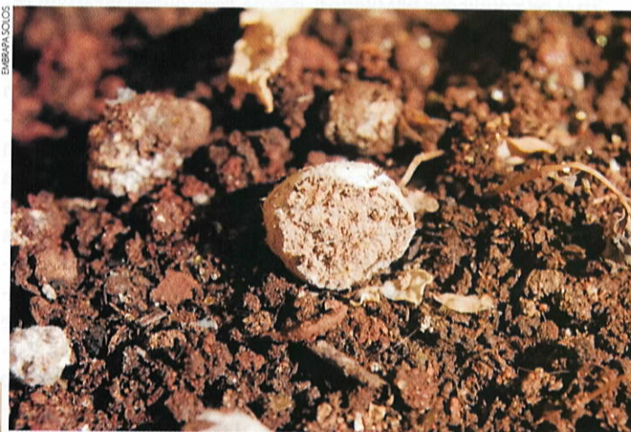
Fertilizante organomineral NPK para plantio de milho produz a partir de dejetos de suínos e/ou cama de aviário (detalhe)