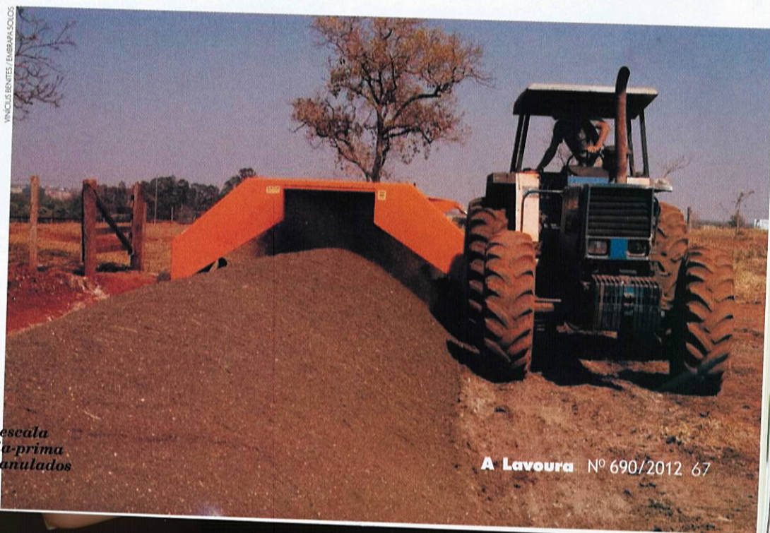
Processamento de compostagem em escala industrial para produção de matéria-prima para fertilizantes organominerais granulados

Em relação às vantagens comparativas do fertilizante organomineral, em relação ao uso de resíduos in natura , observa-se uma redução significativa das perdas de nitrogênio pelo uso de fertilizante organomineral em relação à aplicação