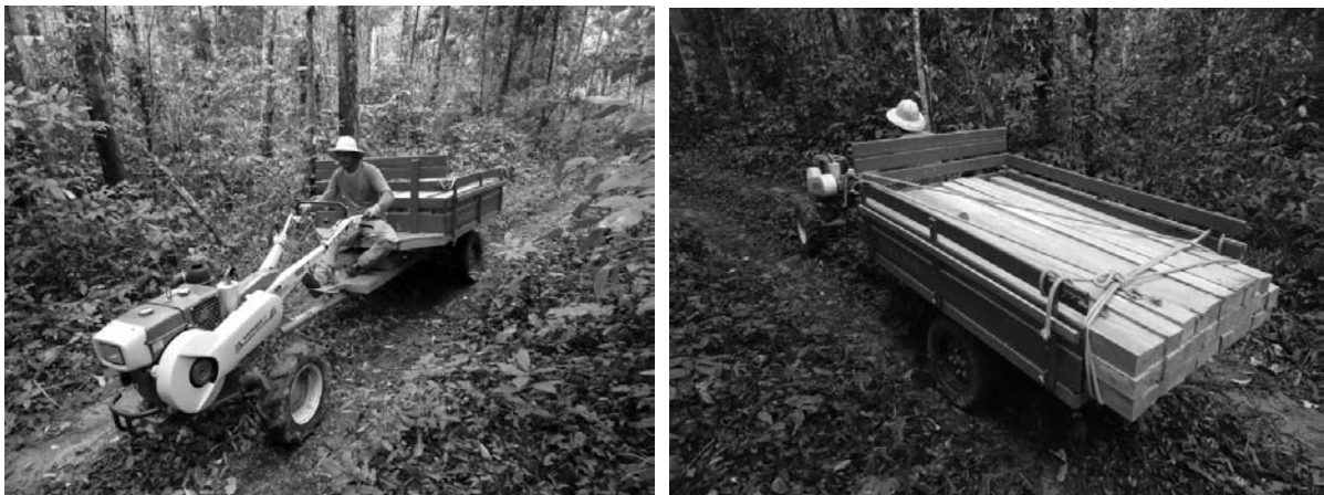
Figura 2. Transporte primário da madeira serrada com micro-tractor e reboque do sistema de manejo florestal comunitário do Projeto de Colonização Pedro Peixoto-AC.

Entre as informações registradas para a definição dos índices técnicos e econômicos deste trabalho citam-se as seguintes: composição da equipe de trabalho; distâncias de abertura ou manutenção (limpeza) de carregadores e picadas; espécie de madeira; DAP; comprimento comercial e diâmetros das extremidades da tora (ponto de corte junto ao solo e extremidade superior, até as primeiras galhadas); condição de aproveitamento da tora (retilínea, tortuosa, partes danificas ou podres e presença de organismos xilófagos); altura do toco remanescente; comprimento e diâmetros das extremidades das secções da tora; tempos das operações (abertura ou limpeza de carregadores e picadas, desganhamento, seccionamento da tora, desdobro, carregamento e transporte, montagem e preparos dos equipamentos); tipos, quantidades e dimensões das peças produzidas; consumos de combustível, óleos e materiais (limas, facões, etc.); preços de aquisição dos equipamentos, combustíveis, materiais, EPI's, etc.; valor corrente praticado da mão-de-obra (diárias) florestal.