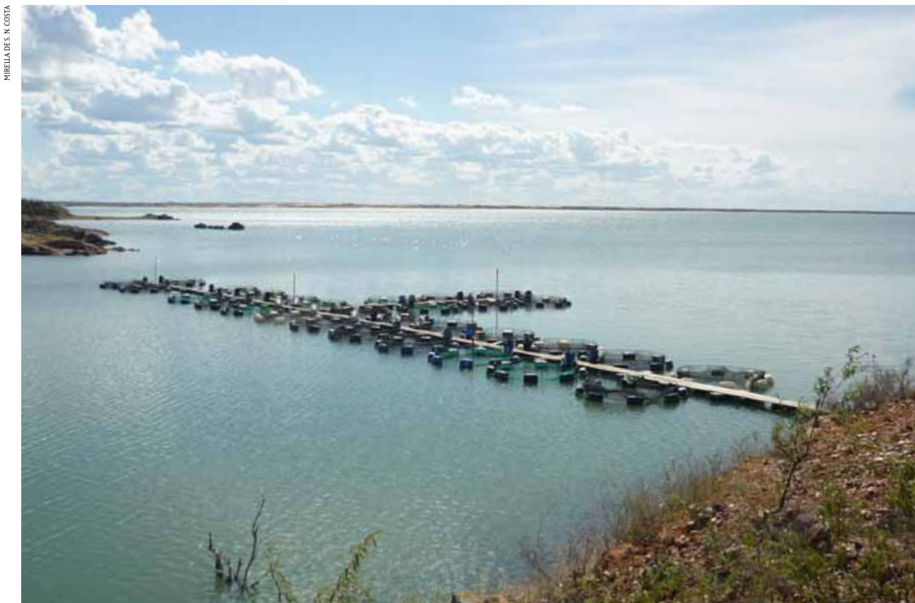
FIGURA 1 | TANQUES-REDE UTILIZADOS EM PISCICULTURAS; MUNICÍPIO DE JATOBÁ, PE, FEV. 2011