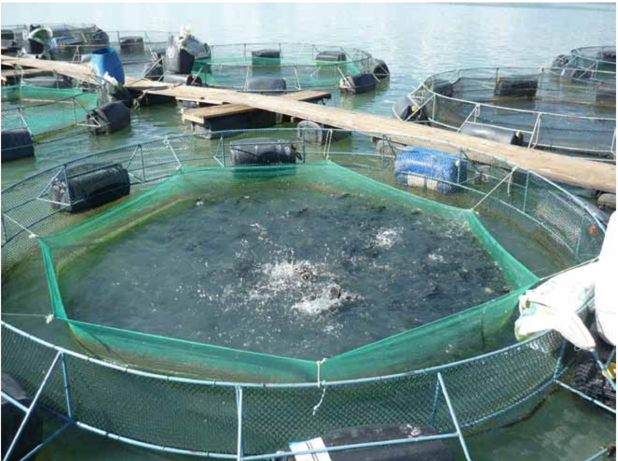
FIGURA 2 | TANQUES-REDE UTILIZADOS EM PISCICULTURAS; PETROLÂNDIA, PE, FEV. 2011

Em 2010, foram realizadas visitas a produtores de diferentes organismos da cadeia aquícola, para aplicação do checklist , sendo 15 localizados em Pernambuco e 3 no Rio Grande do Norte. O objetivo central foi o de verificar a possibilidade de certificação de produtores de pequeno porte, perante os esquemas de certificação disponíveis e o quanto isto implicaria a busca de adequações mais exigentes. Verificou-se que os produtores de Pernambuco necessitam implantar um efetivo sistema de monitoramento da qualidade da água, bem como capacitar os