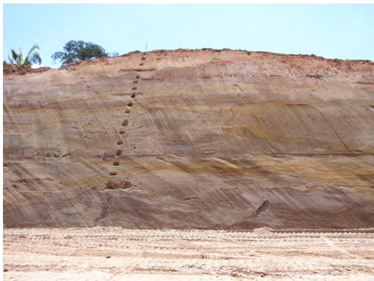
Figura 2. Corte de estrada na BR 364, Município de Tarauacá, AC, indicando diferentes depósitos de materiais sedimentares.

Outra questão tratada foi a revisão dos conceitos dos atributos diagnósticos para a classificação de solos com horizontes B textural e B incipiente, quando ocorrem argilas de alta atividade, apontando-se para a necessidade de estudos mais aprofundados, principalmente em relação à gênese e química de solos.