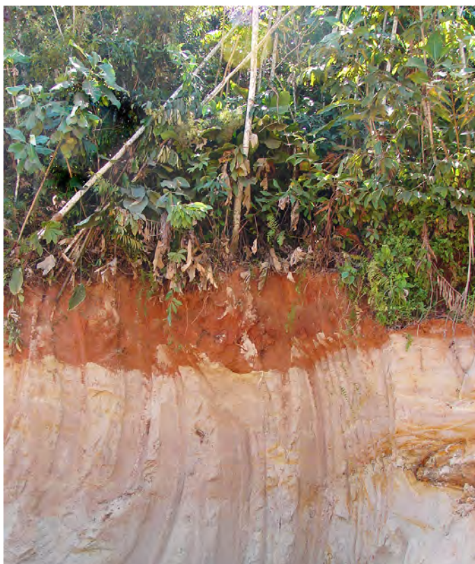
Figura 1. Corte de estrada na BR 364, Município de Tarauacá, AC, mostrando o contato de material argiloso depositado sobre material arenoso.

Na Formação Solimões, a natureza do material de origem na zona de influência pedogenética pode variar desde arenitos, siltitos ou argilitos (Figuras 1 e 2), em função da energia do agente erosivo que resultou nas deposições, na dinâmica dos processos erosivos atuais ou de forças tectônicas recentes, além de influências devidas à geomorfologia regional. Como resultado, modelos pedogenéticos de toposequências destinados a outros ambientes podem se mostrar insuficientes para explicar a distribuição dos solos nas diferentes paisagens e materiais da Formação Solimões.