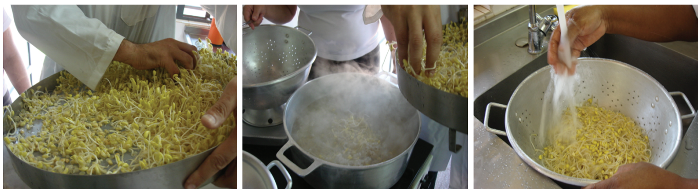
Figura 1. Colheita e branqueamento dos brotos de soja na cozinha experimental da Embrapa Soja.

Foi avaliada a intenção de compra do produto, caso o mesmo estivesse disponível no mercado, apenas questionando os julgadores se eles comprariam, não comprariam ou não tinham opinião até aquele momento.