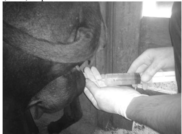
Figura 1: Infusão intramamária de medicamento nanoencapsulado em volume final de 172mL/mama ovina.

Durante a aplicação, não houve sinais de dor intensa local em nenhum dos animais do grupo, apesar dos animais do grupo 2 evidenciarem incômodo durante o final da infusão. Uma possível sensibilidade desencadeada pelo aumento da pressão intramamária, sobretudo nos animais que receberam 172mL pode ter sido amenizada pela temperatura (5-8°C) do produto.