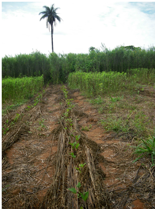
Figura 1. Arranjos de C. argentea com Crotalaria juncea (campo 2). Fileiras com 30 m, com sombreamento distinto, promovido pelo manejo diferenciado dado à C. juncea . Foto: 2 de Março de 2010. Embrapa Milho e Sorgo, Sete Lagoas, MG.

últimos 10 m, nos cinco espaçamentos (no início do florescimento de C. juncea ). Perto de 40 kg de sementes, coletadas em três safras (2010, 2011 e 2012) foram distribuídas para mais de 130 pessoas/instituições nas cinco regiões brasileiras. Foram feitos registros fotográficos de organismos associados às plantas de C. argentea (plantas espontâneas, artrópodos fitófagos ou agentes de controle biológico).