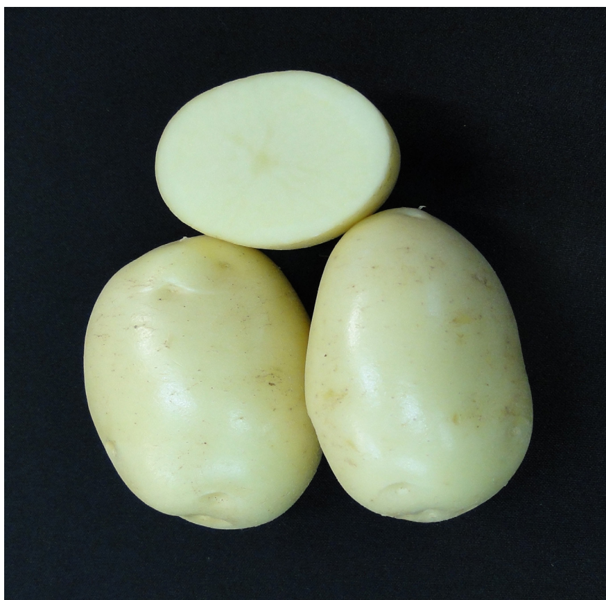
Figura 2. Cultivar BRS Clara (tubers of cultivar BRS Clara). Pelotas, Embrapa, 2013.

respectivamente, maior que ‘Agata’. A superioridade esteve relacionada à ocorrência de requeima, comum neste cultivo. ‘BRS Clara’ também produziu tubérculos de massa média maior ou não diferente dos de ‘Agata’.