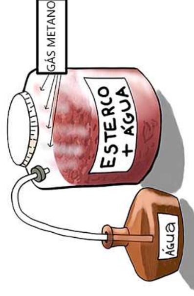
Fig 11.3. Biodigestor utilizando bombona plástica para produção de pequenos volumes de biofertilizante líquido.

Trata-se de um biofertilizante líquido mais simples e bastante conhecido, produzido a partir da fermentação anaeróbica (ausência de ar) de esterco fresco de bovino. O esterco de gado leiteiro possibilita um produto de melhor qualidade, pois os animais recebem dieta mais balanceada, contendo grande variedade de microrganismos, o que acelera a fermentação. Para o seu preparo, o esterco fresco, deve ser complementado ou não com urina, devendo ser misturado em volume igual de água não clorada, sendo a mistura colocada em biodigestor hermeticamente selado. Podem ser empregados bombonas plásticas, tomando-se o cuidado de manter o nível da mistura ao mínimo de 10 cm abaixo da tampa, onde se adapta um sistema de válvula hidráulica