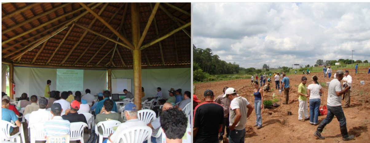
Figura 2: Dia de campo de instalação do SAF, 30 de novembro de 2009.

A área foi preparada aplicando-se calcário para a correção da acidez do solo (2 t/ha). No plantio, foram feitos sulcos nas linhas de árvores aplicando-se cama de frango (1 kg/m) e termofosfato (0,1 kg/m). A instalação do sistema foi iniciada em um Dia de Campo (30 de novembro de 2009) realizado em conjunto com as instituições parceiras e com a participação de agricultores das regiões de Itapeva e Ribeirão Preto, que são membros de uma rede de pesquisa em agroecologia em assentamentos rurais do estado. Neste dia, através de mutirão, foi realizado o plantio de dois módulos do SAF. Na Figura 2 são mostrados registros deste Dia de Campo. O restante do sistema foi implantado nos dias seguintes pelo setor de campos experimentais da Embrapa Meio Ambiente.