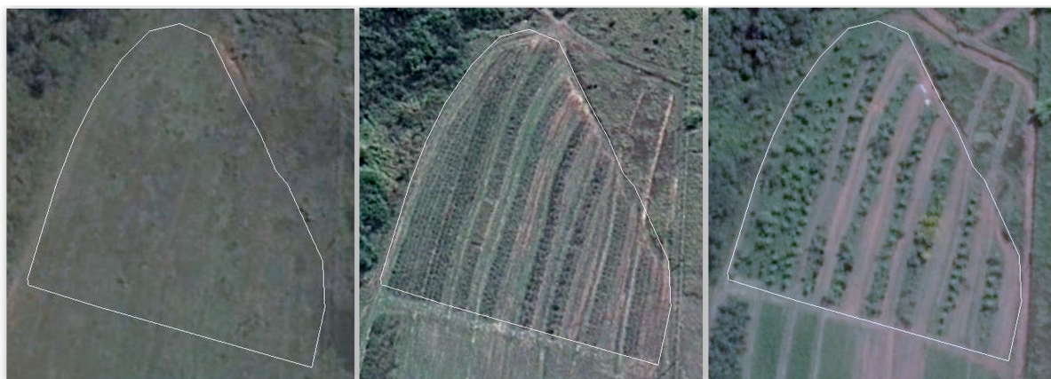
Figura 3: Evolução do sistema.

A Figura 3 apresenta imagens de satélite da área onde foi implantado o SAF em três momentos distintos: 2005, antes da sua implantação; 2010 (com menos de um ano de implantação) e 2012 (terceiro ano após a implantação). Nesta Figura é possível ver a transformação ocorrida na área a partir do seu redesenho, evoluindo de pasto para um sistema complexo. Hoje no SAF, em seu quarto ano após a implantação, entraram em produção as bananeiras, amoreiras, limoeiros e urucum.