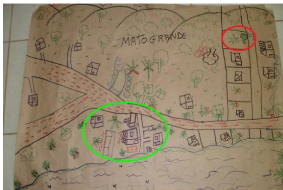
Figura 2 – Representação social dos moradores do Assentamento Mato Grande, Corumbá/MS

Nas discussões que ocorreram durante o desenho do espaço pelo grupo de mulheres do PA Mato Grande observou-se que não houve a representatividade de todas as moradias da localidade, devido à falta de afinidade entre os assentados, resultado de significativo do processo de desunião predominante na área, onde predomina mais o individualismo do que o coletivismo. A atitude individualista ocorre quando todos os moradores querem controlar/dominar ao mesmo tempo, impossibilitando um acordo entre eles. Em geral, um grupo de moradores estabelece normas sem o consenso dos demais, gerando assim intrigas e fofocas resultando em desunião. Também é evidente a ausência do pensamento coletivo, já que em nenhum momento os moradores citaram a presença da associação de moradores, a qual deveria lutar por melhorias de interesse comum aos assentados.