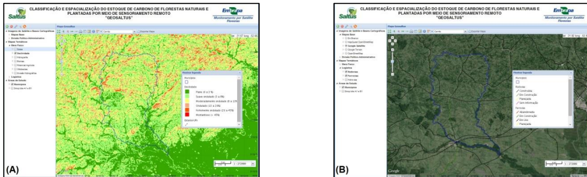
Figura 1. Exemplo de consultas e mapas disponíveis no webgis GeoSaltus: (A) declividade, (B) rodovias e ferrovias – Cerrito, RS.

Até o momento, foram obtidas 122 cenas do Landsat 5 e 39 cenas do Landsat 7 para o BDG do GeoSaltus (Tabela 2). Não foi possível obter todas as cenas com os critérios estabelecidos na metodologia em meses iguais para os diferentes anos, devido à cobertura de nuvens, variando de um ano para outro. Foi gerado um mapa para cada município com seus respectivos anos, conforme representado na Figura 2. Como critério de estudo desses mapas foi levado em consideração a composição colorida RGB – 5/4/3. Foi possível avaliar, preliminarmente, alguns aspectos de uso e cobertura da terra (vegetação arbórea – verde escuro e rugoso, vegetação agrícola ou silvicultura – verde escuro e sem rugosidade, pastagens/campo - verde claro, solo exposto - roxo). Estas imagens serão utilizadas, posteriormente, no projeto para geração de um conjunto de variáveis espectrais e índices de vegetação (IV) das áreas florestais. Estas variáveis serão correlacionadas com parâmetros biofísicos com objetivo de desenvolver metodologia para obter índices de estoque de carbono, baseado na metodologia desenvolvida por Bolfe et al. (2012).