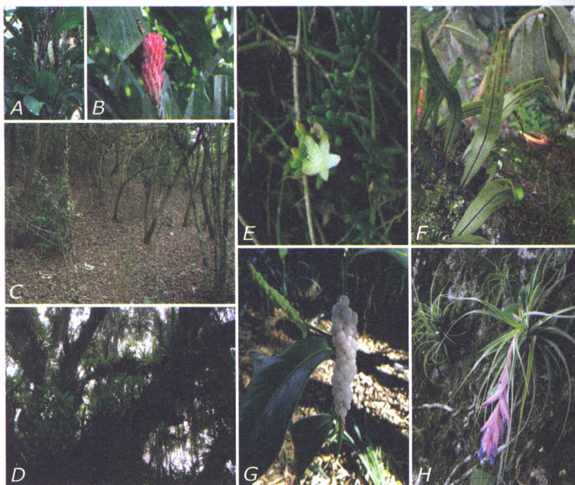
Figura 15.2. Aspecto geral dos ambientes de Terciário (C e D) e espécies de epífitos vasculares registradas: A: Monstera adansonii ; B: Quesnelia quesneliana ; E: Rhipsalis mesembryanthemoides ; F: Pleopeltis astrolepis ; G: Anthurium scandens ; H: Tillandsia stricta .

Como as plantas epífíticas são mais comuns em árvores maiores e mais velhas (ou seja, substratos mais antigos), estas, mesmo que isoladas, servem de suporte à expressiva diversidade de epífitos observada na área do Comperj como um todo. A família Cactaceae é representada nesse compartimento por três espécies nativas. Assim como as bromeliáceas, as cactáceas são importantes nos ecossistemas, pois atraem indivíduos da fauna que consomem seus frutos, aumentando a dinâmica de intercâmbio de propágulos entre os ambientes.