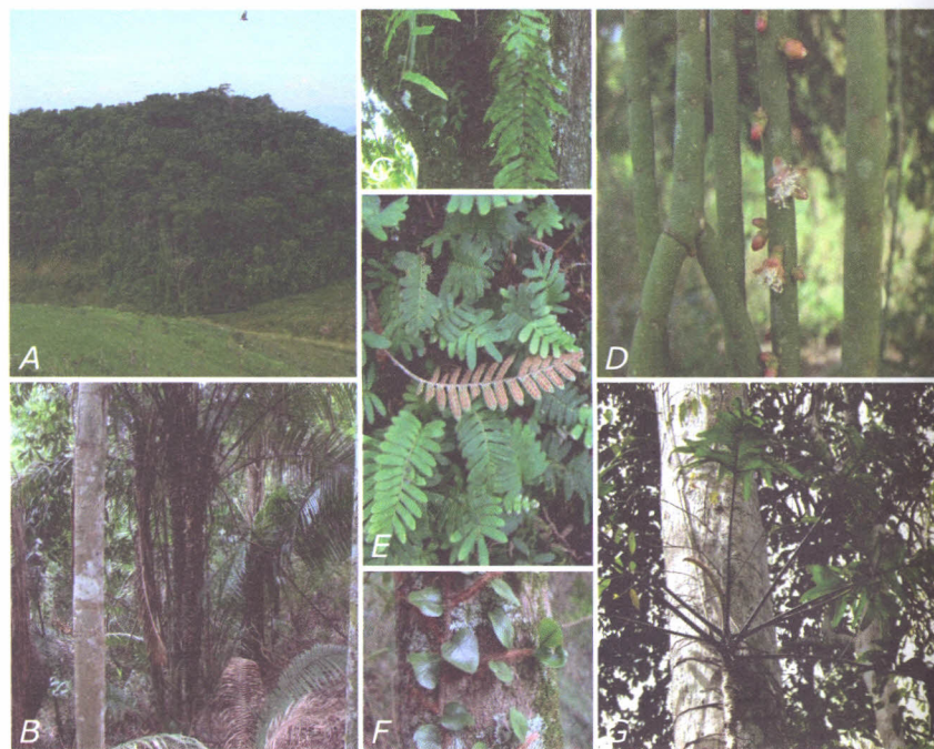
Figura 15.3. Aspecto geral dos ambientes do Proterozoico (A e B) e espécies de epífitos vasculares registradas: C: Serpocaulon meniscifolium ; D: Rhipsalis lindbergiana ; E: Pleopeltis minima ; F: Microgramma vacciniifolia ; G: Philodendron pedatum .

predominantemente das famílias Bromeliaceae e Polypodiaceae, tal como verificado nos demais compartimentos (Figura 15.3). Estas florestas são heterogêneas e exibem dinâmicas sucessionais distintas, algumas com predomínio de cambarás , com baixa riqueza epifítica (Figura 15.3A). Têm como característica marcante a presença de duas espécies de palmeiras – Attalea humilis e Astrocaryum aculeatissimum (Schott) Burret (brejaúba) (Figura 15.3B) – que constituem substrato inadequado para a fixação de epífitos. Ambas provocam forte sombreamento, sendo a primeira acaulescente e a segunda densamente coberta por espinhos, o que resulta em menor disponibilidade de substrato para colonização por epífitos vasculares nessas florestas. Destaca-se também a alta densidade de lianas, observadas em vários fragmentos florestais desse compartimento, como fator negativo para a riqueza epifítica, pois ocupam as superfícies do fuste e dos galhos das árvores e podem desalojar os epífitos mecanicamente mesmo quando já fixados.