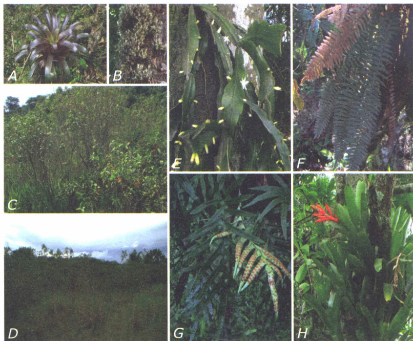
Figura 15.1. Aspecto geral dos ambientes de Quaternário (C e D) e aspecto de algumas espécies de epífitos registradas: A: Vriesea friburgensis ; B: Tillandsia tricholepis ; E: Rhipsalis pachyptera ; F: Pleopeltis hirsutissima ; G: Pleopeltis pleopeltifolia ; H: Aechmea nudicaulis .

As áreas monitoradas no compartimento Quaternário situam-se em planície sobre solos com elevado grau de hidromorfia – Gleissolos Háplicos (Capítulo 1), em que predominam agrupamentos densos de Tibouchina trichopoda (DC.) Baill. (Melastomataceae). Nenhum epífito foi neles observado, o que é coerente com o caráter pioneiro de T. trichopoda em solos saturados hidricamente, além de seu pequeno porte (de no máximo 4 m de altura; Figura 15.1C) e rápido crescimento.